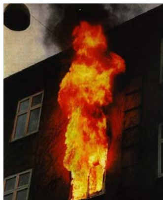
Zimmerbrand nach 15 Minuten. Ziegelfassade unbrennbar.

Ein Zimmerbrand in einem Mehrfamilienhaus in Berlin-Pankow aus dem Jahr 2005 wurde uns im ndr-Film »Wahnsinn Wärmedämmung« gezeigt. Riesige Flammwalzen schlugen aus drei Fenstern. Der zuständige Berliner Feuerwehrchef Broemme formulierte: »Ein solches System gehört verboten«. Die Flammwalzen und das 8 cm dicke WDVS aus Polystyrol wurden in direkte Verbindung ge-