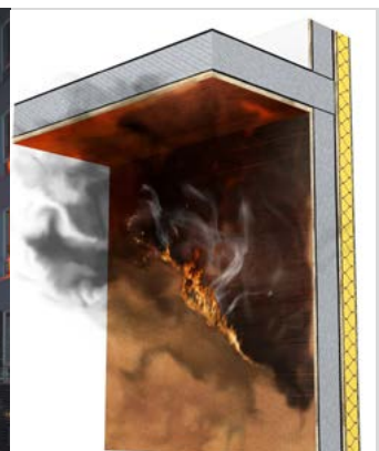
Berliner Brand: Hartfaserplatten innen und außen als verlorene Schalung. Auf deren gefährliche Rolle wurde in den ersten Zeitungsberichten noch hingewiesen, 4 Jahre später jedoch das WDVS zum Problem erklärt.