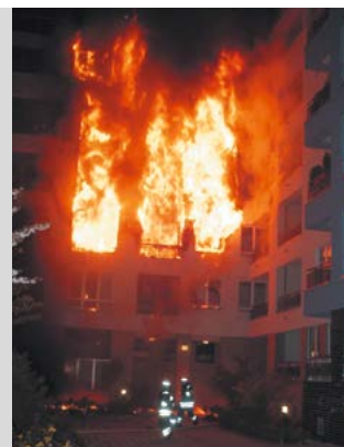
Riesige Flammwalzen beim Berliner Brand durch 5 cm Hartfaserplatten auf den Wänden und Mitbrand des Polystyrols. Deutlich schlagen die Flammwalzen aus den Fenstern - und nicht aus der Fassade..